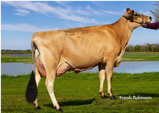
JX LUCKY HILL WILDFLOWER {6} GRANDDAM