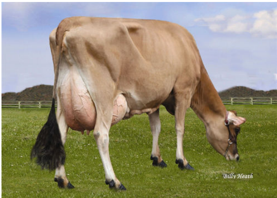
LUCKY HILL JOKER WABORITA FOURTH DAM